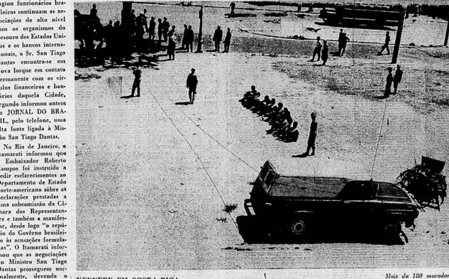
KENNEDY EM COSTA RICA

Em Brasília, o Presidente João Goulart assegurou ao Presidente do Congresso, Presidente da Câmara e ao líder do PTB e PSD, que nunca deu ordem para suspender as negociações filiais com o Estado Unidos. (Ver notícia na página 3 e Coluna de Notícias, na página 4)