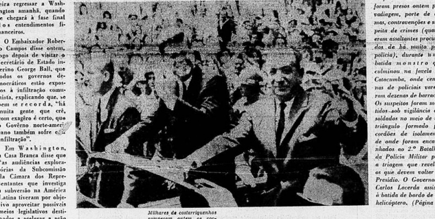
Milhares de contingentes romparam ontem os cordões de isolamento para assistir, com o maior interesse da história do seu país, o Presidente John Kennedy, que chegou a São José da Costa Rica para o reinício de Iriás dia com o Presidente depois da saída de Guatemala, Nicarágua, Salva-dor, Honduras e Panamá. Em seu discurso Kennedy disse que a América Central constitui um campo de batalha crucial de progresso libertador. Com os cobras da desconfiança, Kennedy respondeu perguntas da imprensa sobre a situação da América Central, dizendo que se não tivesse a visita de Kennedy, não seria possível a situação atual da América Central. (Página 12)