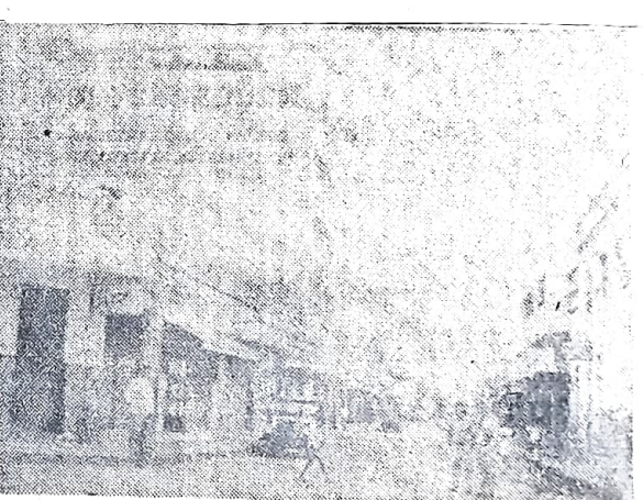
Na fotografia acima o Edifício A Vencedora, majestoso prédio de quatro andares, construído na cidade de Juazeiro do Norte, de propriedade do sr. Severino A. Sobrinho. Sua inauguração está marcada para o próximo dia 11 de abril. (Foto de Carlos Alberto Marques, especial para O POVO enviada pelo nosso correspondente Daniel Walker).